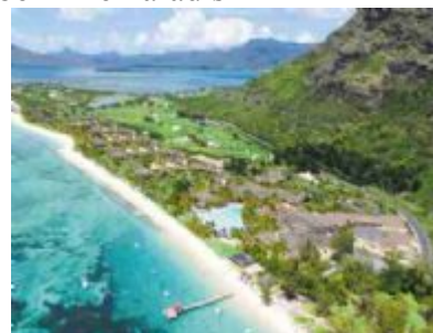
Dinarobin - Luftaufnahme