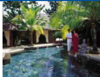
Dinarobin - Dinarobin Spa