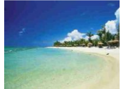
Dinarobin - Strand