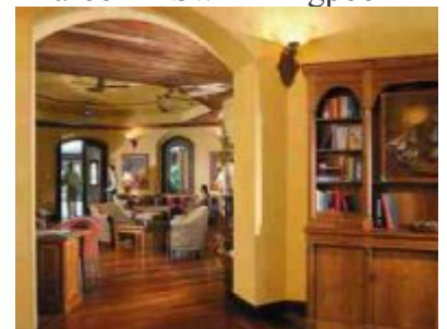
Dinarobin - The Club