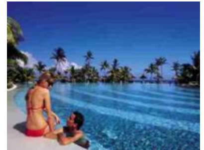
Dinarobin - Swimmingpool