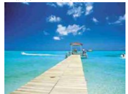
Dinarobin - Wassersport