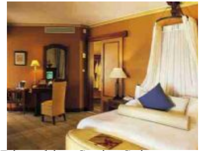
Dinarobin - Senior Suite