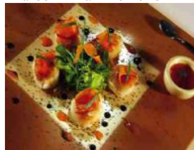
Dinarobin - für Gourmets